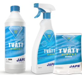
1 liter 0,5 liter Tvättduk

1 liter Mögel-Fri brukslösning (spädes ej) räcker till ca 5 m 2 .