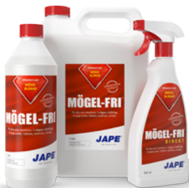
1 liter 5 liter 0,5 liter

1 liter Prick-Fri utspädd till 5 liter brukslösning räcker till ca 25 m 2 .