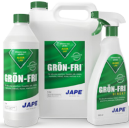
1 liter 5 liter 0,5 liter

En serie effektiva desinfektions- och rengöringsmedel från Jape. Väljer du dessa produkter får du ett heltäckande system för underhåll av fasader och andra ytor. Samtliga produkter är biologiskt nerbrytbara.