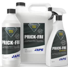
1 liter 5 liter 0,5 liter

1 flaska Grön-Fri Direkt räcker till ca 2,5 m 2 (spädes ej)